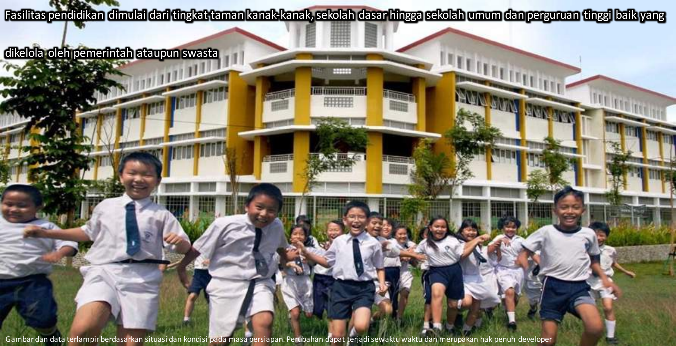
Gambar dan data terlampir berdasarkan situasi dan kondisi pada masa persiapan. Perubahan dapat terjadi sewaktu waktu dan merupakan hak penuh developer

Fasilitas pendidikan dimulai dari tingkat taman kanak-kanak, sekolah dasar hingga sekolah umum dan perguruan tinggi baik yang dikelola oleh pemerintah ataupun swasta