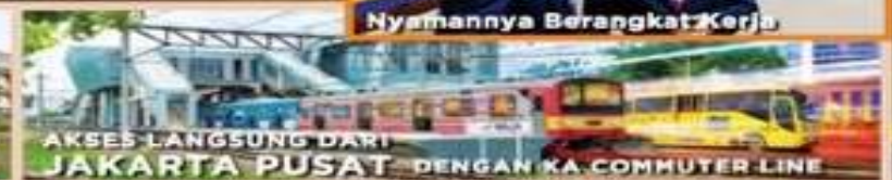
AKSES LANGSUNG DARI JAKARTA PUSAT DENGAN KA COMMUTER LINE