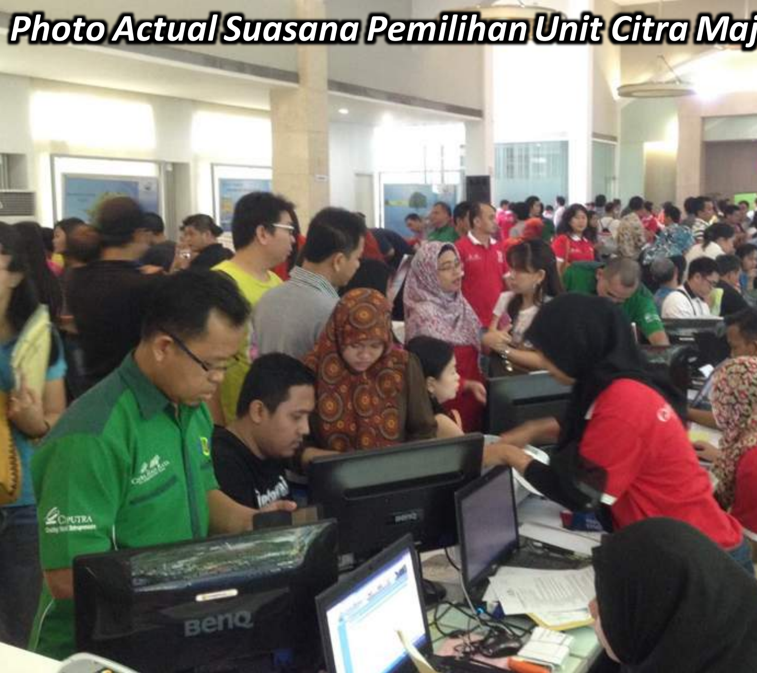
Photo Actual Suasana Pemilihan Unit Citra Maja Raya