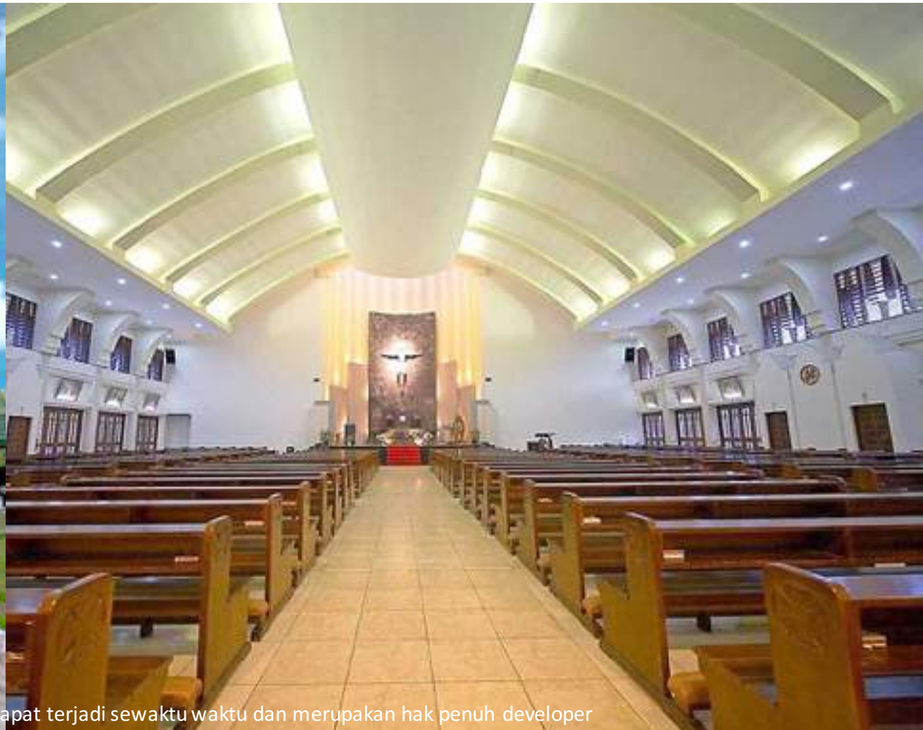
Gambar dan data terlampir berdasarkan situasi dan kondisi pada masa persiapan. Perubahan dapat terjadi sewaktu waktu dan merupakan hak penuh developer