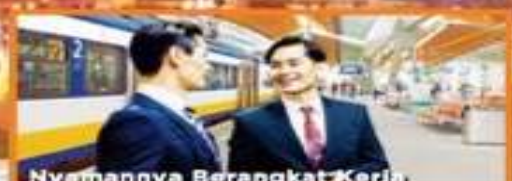
Nyamannya Berangkat Kerja