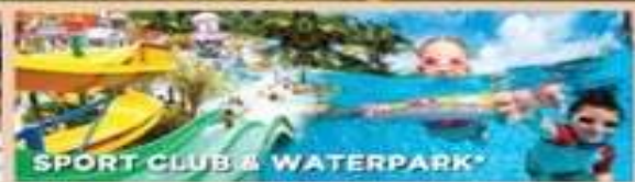
SPORT CLUB & WATERPARK*